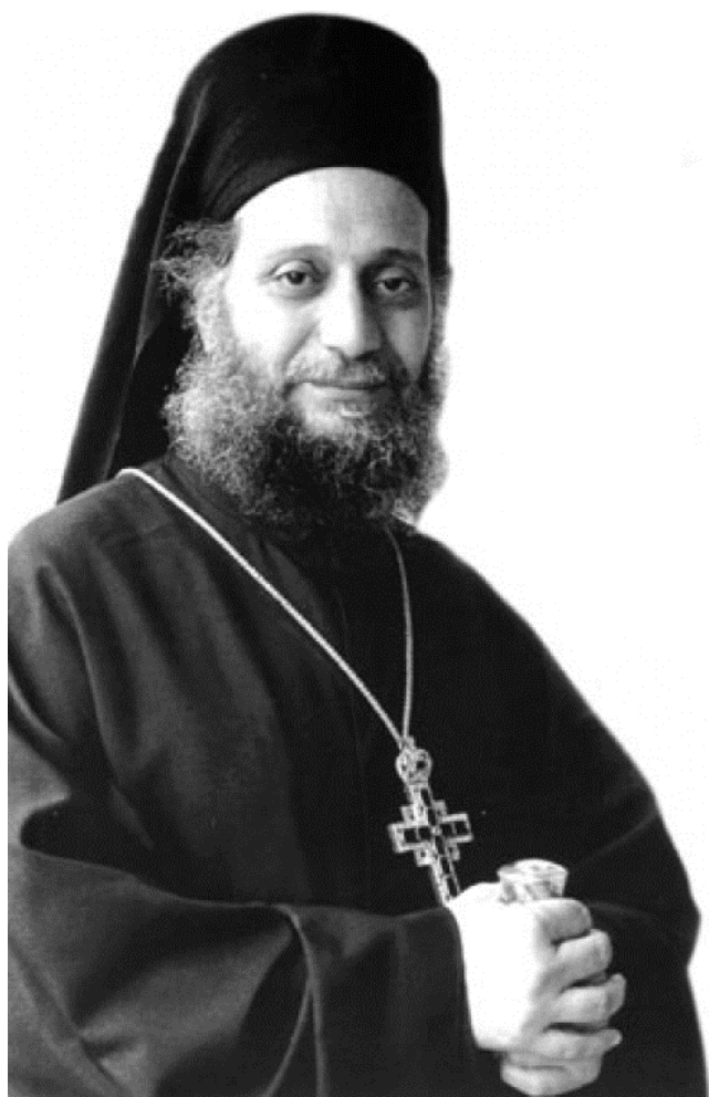
ARHIM. EMILIANOS SIMONOPETRITUL