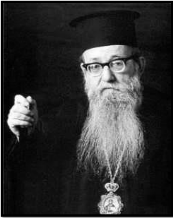
MITROPOLITUL AUGUSTIN DE FLORINA