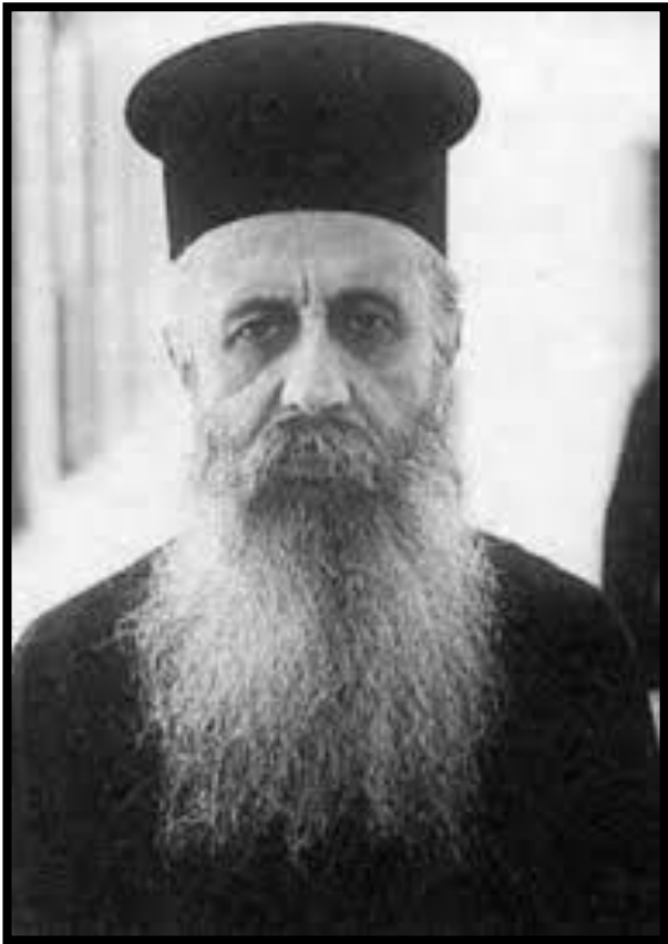
PĂRINTELE EPIFANIE TEODOROPULOS