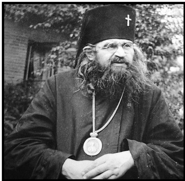
SFÂNTUL IOAN MAXIMOVICI

Sursa: Arhimandritul Sofronie , Scrisori către familia protoiereului Boris Stark , Editura Accent Print